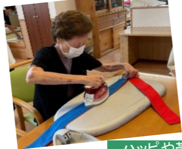
ハッピー帯にアイロンかけ