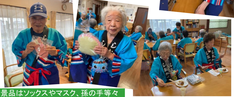
景品はソックスやマスク、孫の手等々