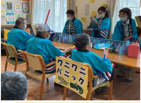
皆で踊った 瀬戸大橋音頭