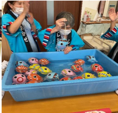
タコちゃんヨーヨーつり