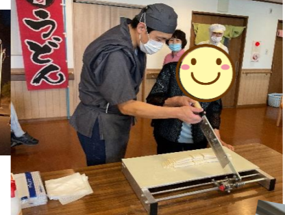
手打ちうどん体験