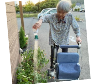
陽が落ちてからのお水やり