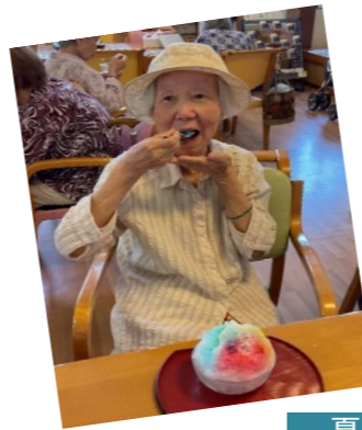
夏はやっぱりかき氷