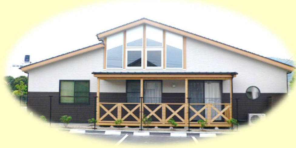
表紙の写真は 岐阜県関市「モネの池」